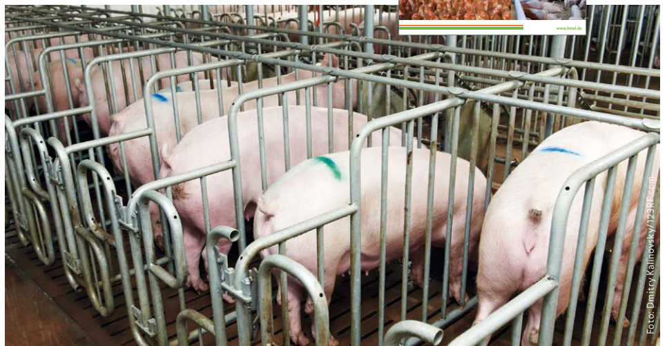
Die Exportorientierung führt zwangsläufig zur Kostenoptimierung in der Nutztierhaltung.

Unvermeidbar ist bei einer tier- und umweltfreundlichen Tierproduktion, dass die Exporte von Fleisch und Milch zurückgehen. Auf internationalen Märkten lassen sich höhere Verkaufspreise mit dem Verweis auf nachhaltigere Erzeugungsbedingungen nicht durchsetzen.