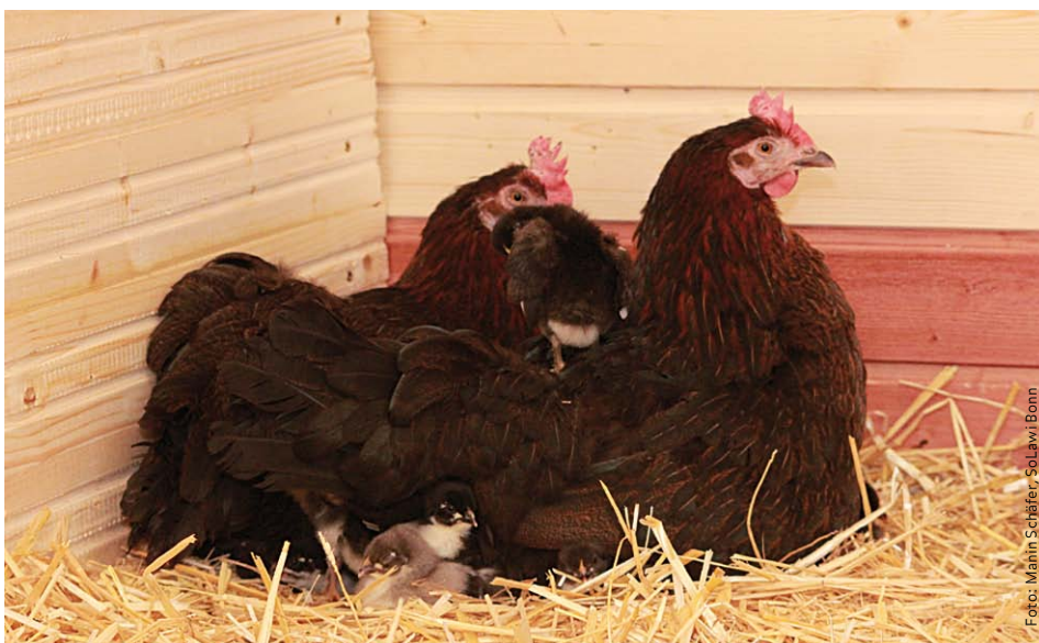
Diese Hühner können sich glücklich schätzen: Ihre Schnäbel wurden nicht gekürzt und sie werden auch entsprechend artgerecht gehalten.