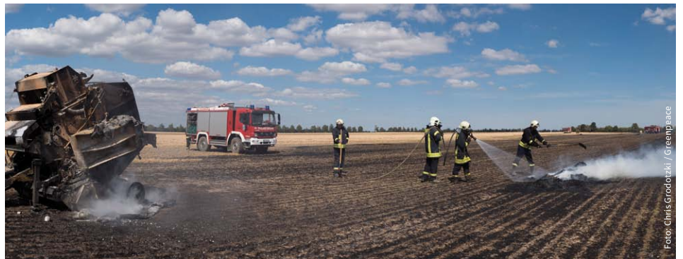
Die Zukunft der Landwirtschaft? Feuerwehr bei Löscharbeiten eines Feldbrandes während der Hitzeperiode Anfang Juli bei Thallwitz, Sachsen.

Die Europäische Kommission will die Agrarpolitik an den globalen Zielen für nachhaltige Entwicklung ausrichten – hält aber bisher an den gescheiterten Instrumenten fest