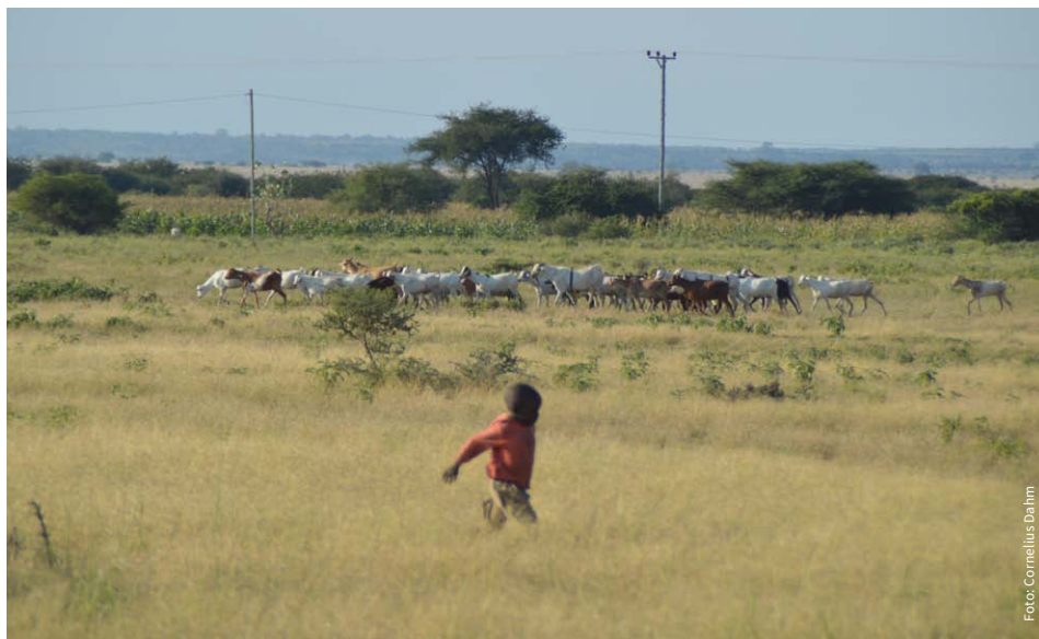
Eine frei weidende Ziegenherde im District Monduli.