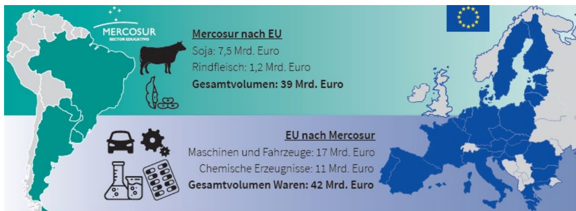
Abbildung 1: Handel von Rindfleisch, Soja, Milch- und Industrieprodukten zwischen der EU und dem Mercosur im Jahr 2018.

Die Europäische Union (EU) ist für den südamerikanischen Staatenbund Mercosur 1 nach China die zweitwichtigste Handelspartnerin. 2019 importierte die EU Agrargüter im Wert von mehr als 19,6 Milliarden Euro aus den Mitgliedsstaaten des Mercosur und verkaufte Agrarprodukte im Wert von 2,4 Milliarden Euro in die Mercosur-Länder. Beide Wirtschaftsblöcke schützen bislang ihren Agrar- und Lebensmittelsektor durch Handelshemmnisse vor billiger produzierten Importen aus dem Ausland.