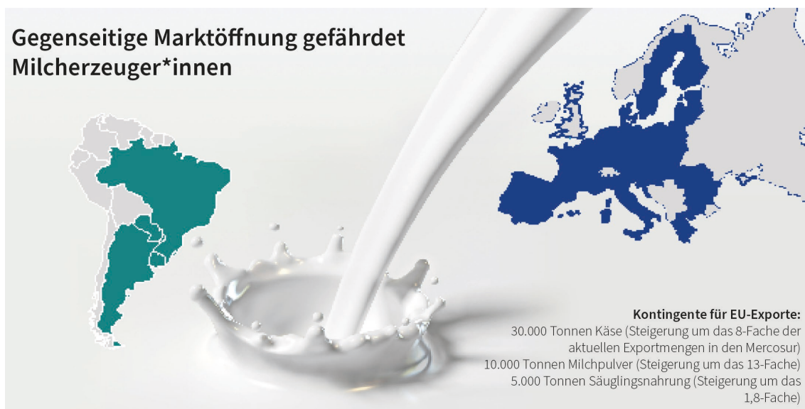
Abbildung 2: Exportsteigerung von Milchprodukten durch das EU-Mercosur-Abkommen

Nach 20-jähriger Verhandlung haben sich die EU und der Mercosur auf ein Handelsabkommen geeinigt. Dadurch soll eine Freihandelszone mit rund 800 Millionen Einwohner*innen entstehen. Ziel ist, den Handel zwischen den beiden Wirtschaftsblöcken zu steigern, indem Handelshemmnisse, wie Zölle und Exportsteuern, abgebaut werden. Außerdem sollen einheitliche Standards festgelegt werden und gemeinsame Werte wie nachhaltige Entwicklung, Arbeitnehmer*innenrechte und Klimaschutz gestärkt werden. Die Ratifizierung des Abkommens durch den Europäischen Rat und die Mitgliedsstaaten der EU steht noch aus. Verschiedene Mitgliedsstaaten wollen dem vorliegenden Vertrag so nicht zustimmen, da sie befürchten, dass Standards nicht ausreichend erfüllt werden. Bauernverbände und zivilgesellschaftliche Gruppen aus dem Mercosur und der EU kritisieren das Abkommen heftig, weil billigere Agrarimporte die lokale landwirtschaftliche Produktion gefährden.