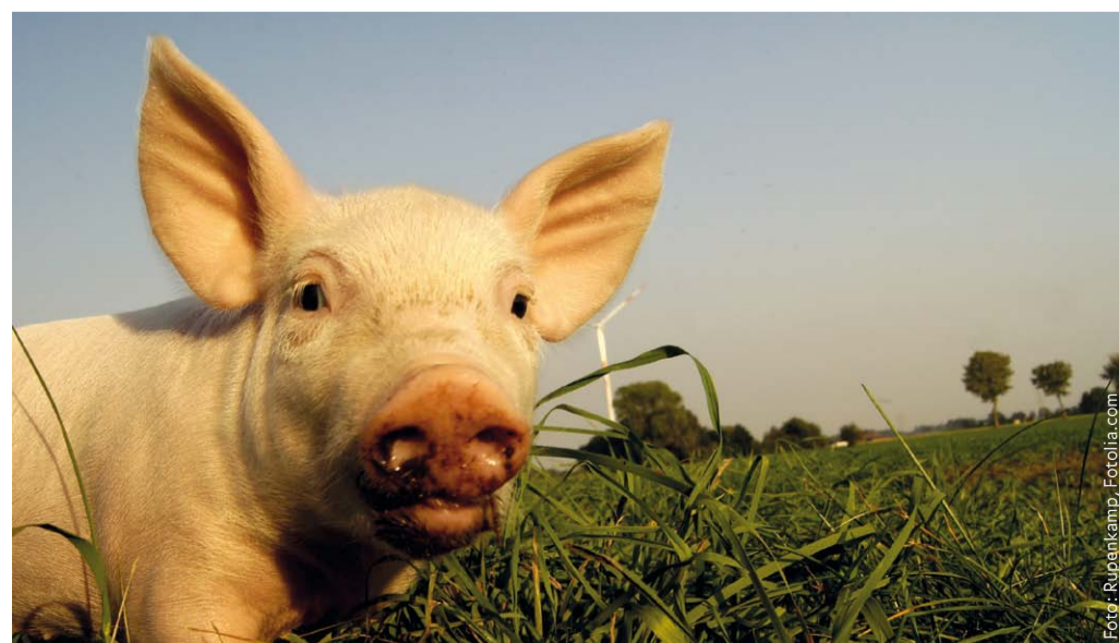
Schwein gehabt – von solchen Lebensbedingungen können Mastschweine in der Regel nur träumen.