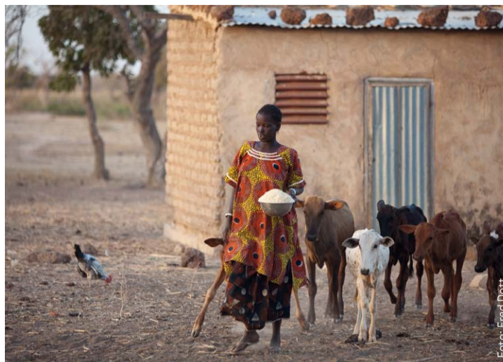
Der Zugang zu Ressourcen, vor allem Land, ist für Kleinbäuerinnen und Kleinbauern in den Ländern des Südens lebenswichtig.

Werden die Leitlinien angewendet, können sie ein wichtiger Schritt sein, um die Situation von Kleinbäuerinnen und -bauern in den Ländern des Südens entscheidend zu verbessern. Mit ihren Mindeststandards könnten die Rechte besonders armer und an den Rand gedrängter Bevölkerungsgruppen besser als bisher