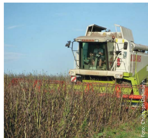
Ackerbohnenenernte in Warstein/Westfalen

Es darf aber nicht unerwähnt bleiben, dass es auch pflanzenbauliche Probleme gibt. Speziell