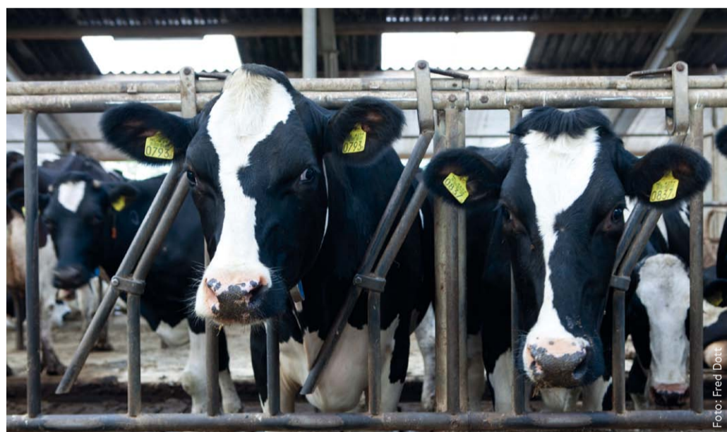
Tierhaltung ist die mit Abstand wichtigste Treibhausgasquelle in der Landwirtschaft.