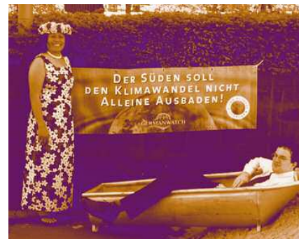
Die Klima-AUSBADE-Kampagne auf dem Evangelischen Kirchentag 2005 in Hannover mit zwei Mitgliedern des Pazifik-Netzwerkes

kann man Klimaschutzprojekte im Süden unterstützen, um so Emissionen in der Höhe der Klimawirkung eines bestimmten Fluges zu reduzieren. Atmosfair ist mittlerweile als gemeinnützige GmbH etabliert. Mehr Informationen finden Sie unter www.atmosfair.de .