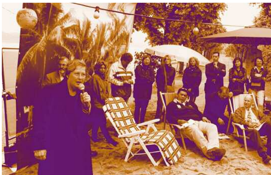
Barbel Höhn als engagierte Rednerin bei der „Strandnahme für Erneuerbare Energien, Klimaschutz und nachhaltige Entwicklung“

Für den Finanzsektor entsteht mit dem Inkrafttreten des Kyoto-Protokolls und dem Beginn des europäischen Emissionshandelssystems die Notwendigkeit, Unternehmen danach zu beurteilen, wie gut sie sich auf eine treibhausgasbegrenzte Zukunft einstellen. Unternehmen, die nicht durch geeignetes Risikomanagement reagieren, werden für Investoren zum Finanzrisiko. Bei anderen Unternehmen, die etwa durch den Klimaschutz ihre Effizienz steigern, ent-