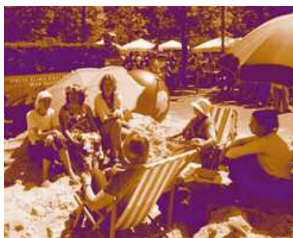
Der Kirchentagsstand von Germanwatch und dem Pazifik-Netzwerk bot vielen Besuchern Schutz vor der Sonne!

deckt der Finanzmarkt hingegen neue ökonomische Chancen. Im deutschen Sprachraum sind diese neuen Tendenzen des Finanzsektors kaum bekannt, weder in der Öffentlichkeit noch bei Entscheidungsträgern in der Politik und oft auch nicht in den nur indirekt betroffenen Teilen der Wirtschaft. Deshalb hat Germanwatch im Rahmen der Klima-AUSBADE-Kampagne eine Broschüre für Entscheidungsträger und Presse zusammengestellt. Die Broschüre stellt diese neuen Entwicklungen dar und diskutiert Möglichkeiten, wie die Finanzwirtschaft weiterhin und noch verstärkt eine den Klimaschutz unterstützende Rolle spielen könnte. Die Broschüre kann demnächst unter www.klimaausbadekampagne.de abgerufen werden.